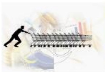
Retail trade sector