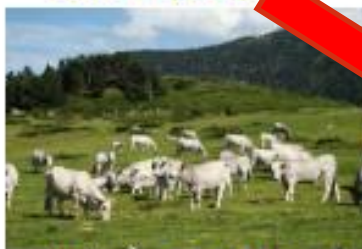
Agriculture - Crop and Animal Production