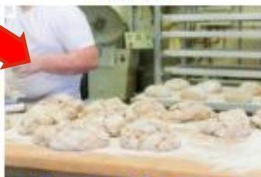
Food and Beverage Manufacturing