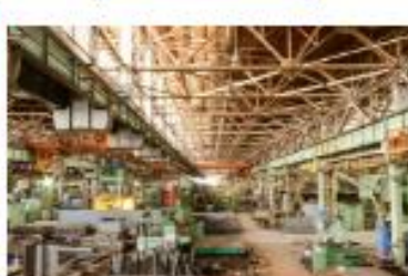
Fabricated Metal Products