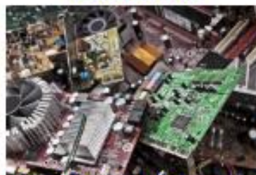
Electrical and Electronic Equipment Manufacturing