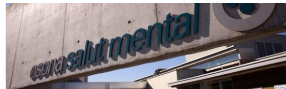
Osona Salut Mental