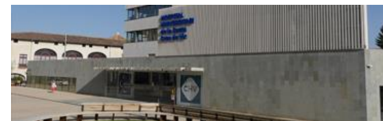
Àrea de Rehabilitació HUSC