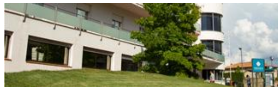
Clínica de Vic