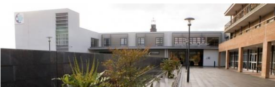
Hospital Sant Jaume de Manlleu