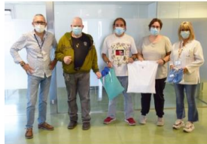
Representants del CHV i de la Fundació Dr. Trueta en el lliurament de les bosses de roba

Ha estat un projecte que hem pogut viure d'aprop, fins i tot amb visites de professionals a les instal·lacions observant de primera mà el volum de residu que generem i també la magnífica tasca que porta a terme la fundació.