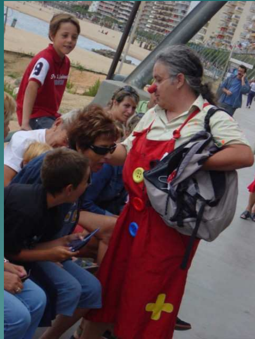
Capmanya de prevenció de residus a les platges