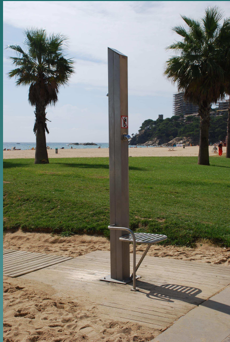
Capmanya d'estalvi d'aigua a les dutxes