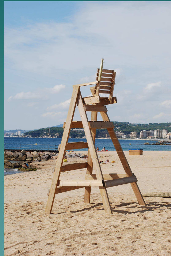
Manual de Bones compres- cadira de fusta certificada

Municipàlia, Lleida, 23 d'octubre de 2007