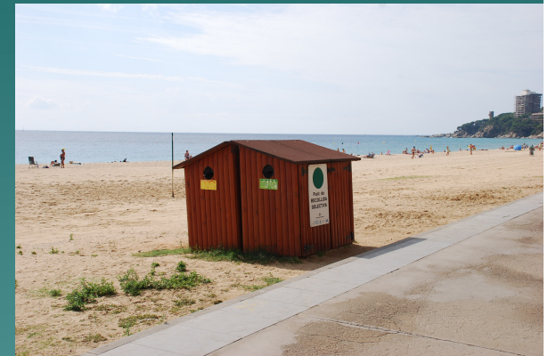
Punts verds de recollida selectiva