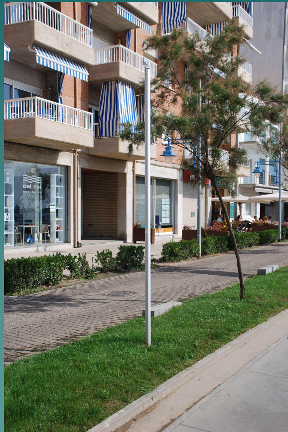
Sensors d'humitat al passeig marítim